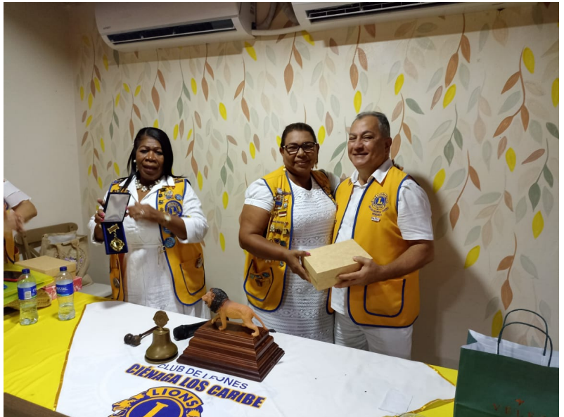
Visita del C. L. Gobernador Jairo Cáceres Machado y su Gabinete distrital al Club de Leones Ciénaga Los Caribes.