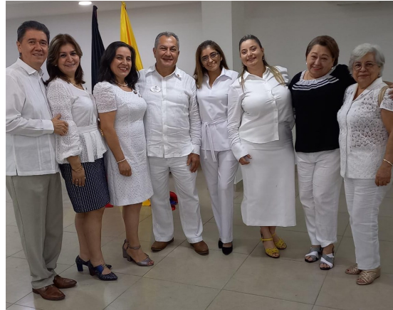
Juramentación masiva de Nuevos Socios organizado por el Consejo de Presidentes de los Clubes de Leones Área Norte de Santander.